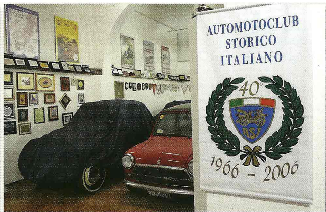
Uno scorcio dell'interno della sede del Topino Club di Piazza 2 Giugno