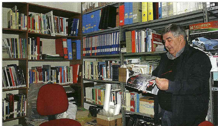
Un angolo della 'Biblioteca delle auto' aperto agli appassionati ogni martedì pomeriggio

Per informazioni e contatti: Telefono e fax 0586/406034 www.topolino-clublivorno.it