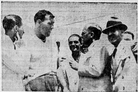
PRIMO CARNERA è intervistato dal nostro Collana a bordo del «Conte di Savoia»